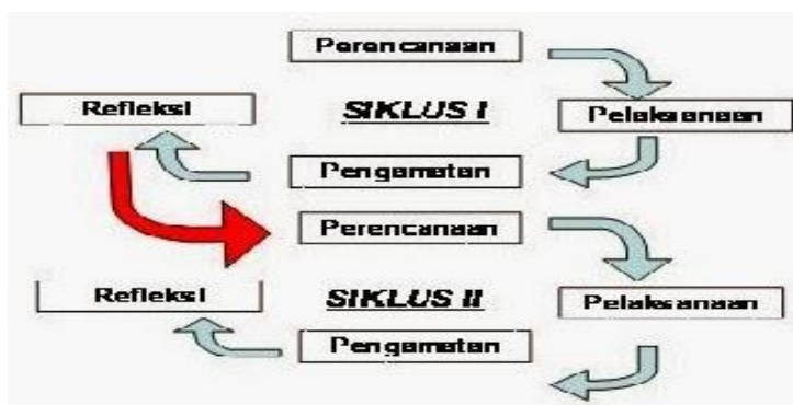
Gambar 1. Prosedur Penelitian

Penelitian tindakan kelas ini dilaksanakan selama 2 siklus pada satu kompetensi dasar yaitu KD 3.30. Menentukan nilai limit fungsi aljabar. Setiap siklus dua kali pertemuan dengan alokasi waktu 2 JP setiap pertemuan, yang dilanjutkan dengan tes evaluasi di akhir siklus.