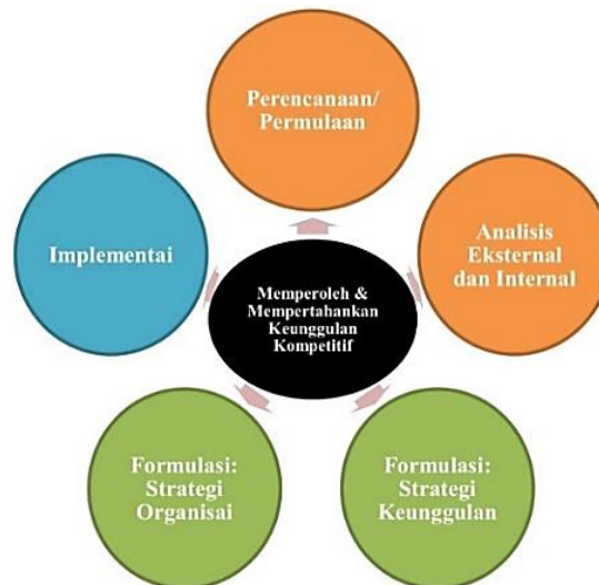
Gambar 1. Kerangka Strategis untuk Menerapkan Pandangan Manajemen Strategik

Salah satu definisi manajemen strategik adalah proses dimana pilihan organisasi yang mempengaruhi kualitasnya dibuat melalui integrasi tiga fase, diantaranya yaitu: formulasi/perencanaan, implementasi/penerapan, dan evaluasi. Keputusan yang diambil untuk mencapai tujuan organisasi diputuskan dan dipantau oleh pemimpin organisasi (Fadhli, 2020). Memasukkan manajemen strategik ke dalam organisasi bukanlah hal yang mudah, hal ini membutuhkan dukungan penuh dan pemahaman dari setiap karyawan. Jadi, ada langkah-langkah yang harus dipelajari dan diikuti saat menerapkan manajemen strategik. Tujuan dari manajemen strategik adalah untuk mendapatkan keunggulan kompetitif melalui integrasi atau kombinasi analisis, formulasi, dan pelaksanaan. Menurut (Rothaemel, 2017), ada tiga kerangka utama untuk menerapkan perspektif manajemen strategik: analisis, formulasi, dan pelaksanaan.